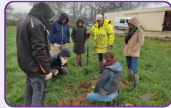
Réunion technique Maraîchage "Engrais verts" - février 2023