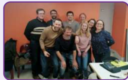
Réunion technique fertilisation et bilan du GIEE "Elevage en AB et changement climatique : comment être résilient ?" - décembre 2023