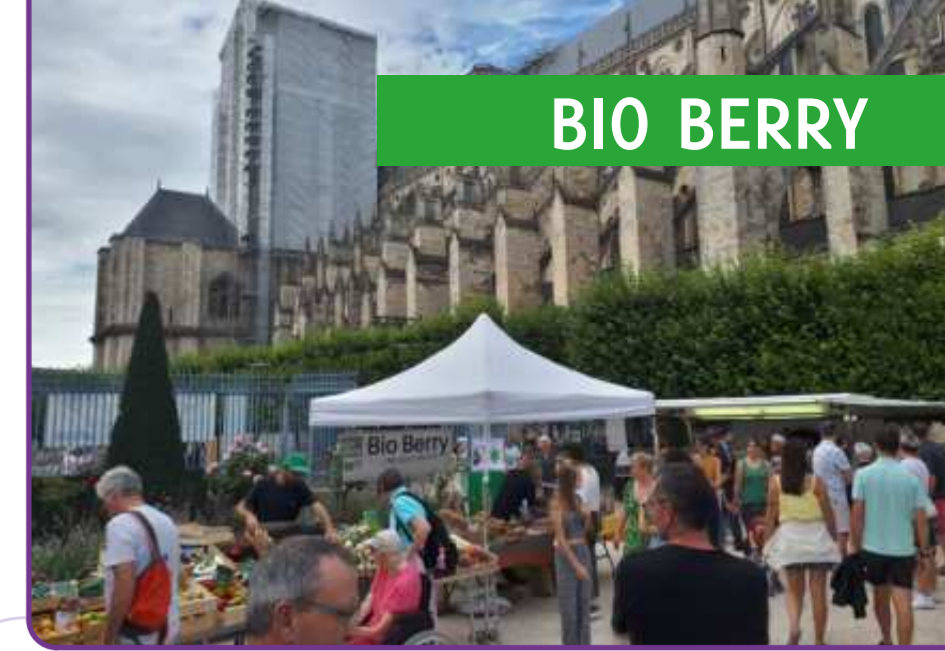
Bourges se fait bio 2023 - septembre 2023