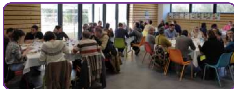
Assemblée générale du GABB18 - mars 2023