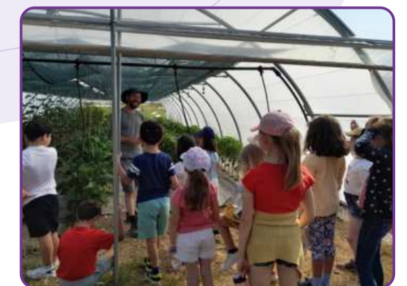
Visite de la Ferme des Beaux Regards dans le cadre des animations en écoles primaires de Bourges - juin 2023