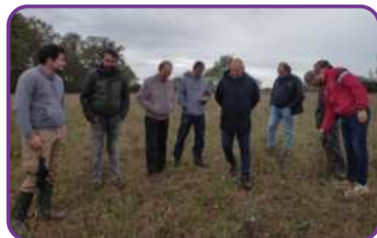
Rallye Herbe du collectif GIEE "Elevage en AB et changement climatique : comment être résilient ?" - novembre 2023