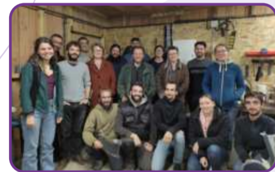
Réunion technique Maraîchage "Qualité et conservation des légumes" - novembre 2023