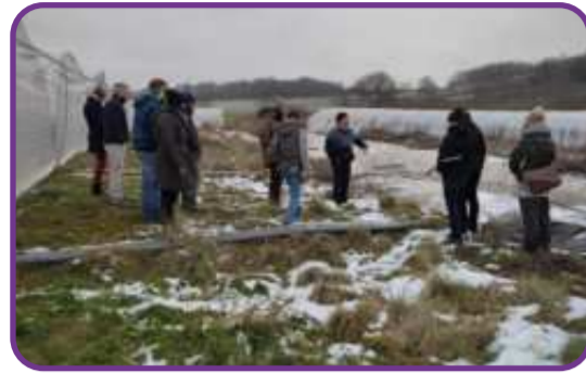
Voyage d'étude Maraîchage : Dérèglement climatique : adopter un pilotage agronomique et économie de l'irrigation en maraîchage bio - janvier 2023