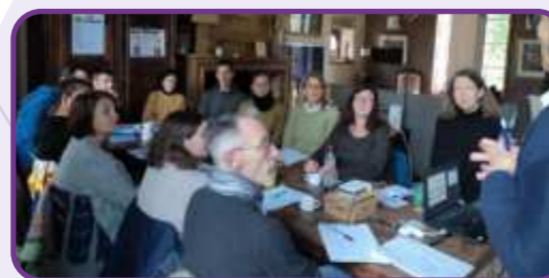
Formation : transformation des produits de l'exploitation : Comprendre la réglementation sanitaire - novembre 2023