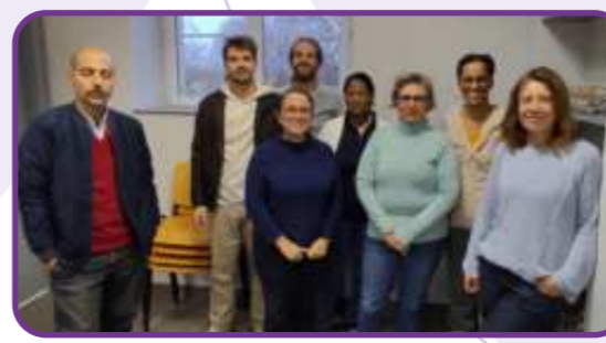
Présentation des actions du GABB18 auprès des BPREA du Lycée agricole - décembre 2023