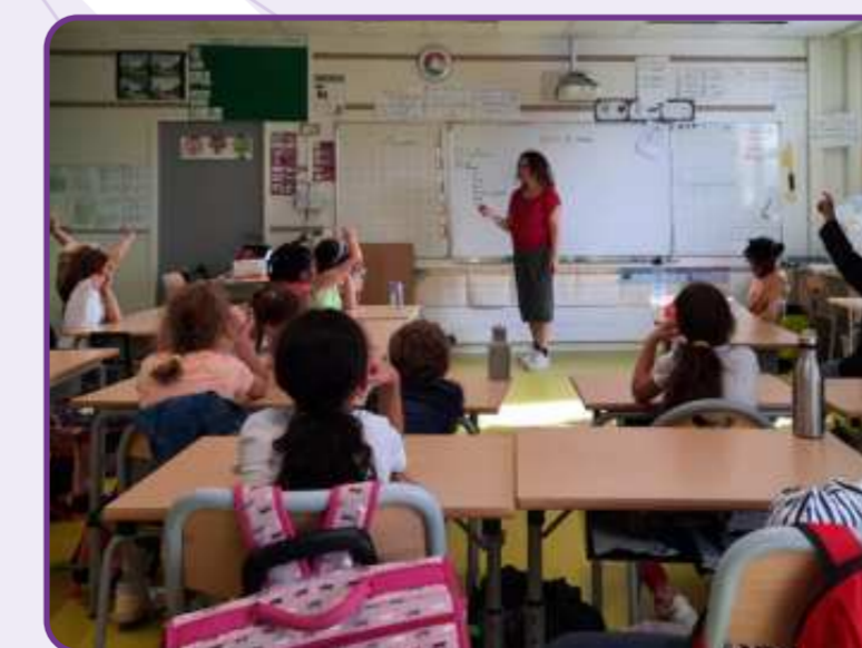
Intervention auprès d'une classe de CM1 "comment fabrique-t-on du fromage ?" - octobre 2023